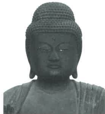
長楽寺蔵 薬師如来坐像