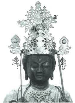
観福寺蔵 弥勒菩薩坐像

和泉国の国府所在地として古くから栄えた和泉市には、豊かな仏教文化が伝えられてきました。近年は市史編さん事業に伴う史料調査が進み、今まで知られていなかった仏教関連遺物がぞくぞくと発見されています。