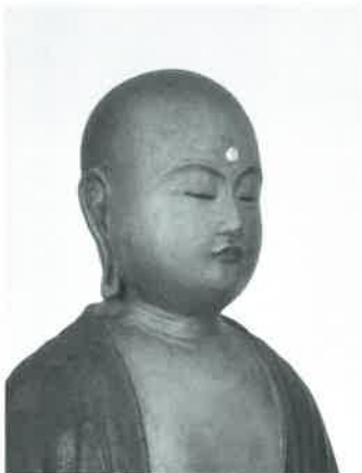
施福寺 地藏菩薩立像