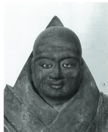
妙泉寺蔵 日像上人坐像