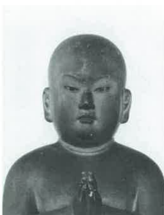
大泉寺 聖徳太子立像