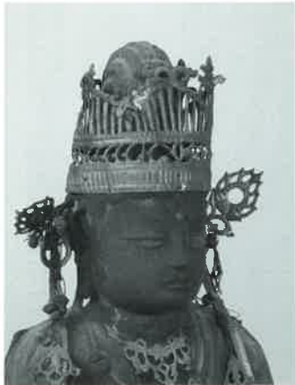
施福寺 大日如来坐像

今回は仏像彫刻や絵画だけでなく、仏教興隆に力を注いだ「ひと」にもスポットを当て、肖像や仏具、経典も展示するほか、人々が祈りをこめて埋納した槇尾山経塚の出土品を展示します。