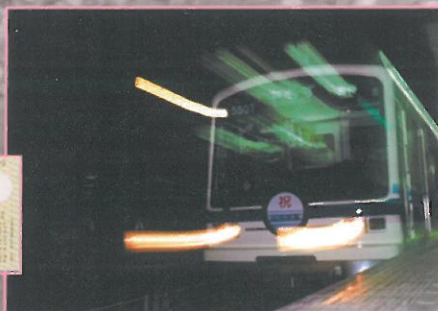
和泉中央駅の一列車