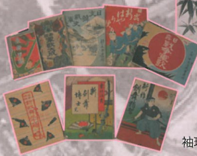
袖珍本 (しゅうちんほん)