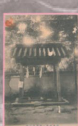
絵葉書 (姿見の井戸)