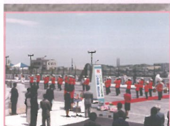
いぶき野街ひらき式