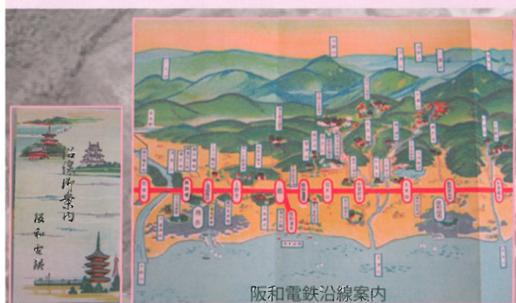
阪和電鉄沿線案内