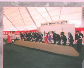
和泉キャンパス起工式