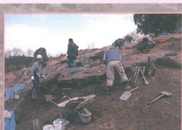
和泉中央丘陵の発掘