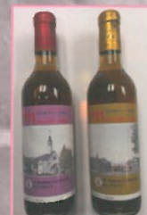
和泉キャンパス 開設記念ワイン