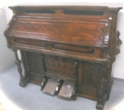
大正時代のヤマハオルガン (桃山学院史料室蔵)