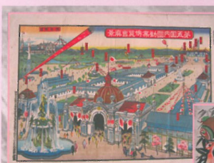
第五回内国勲業博覧会