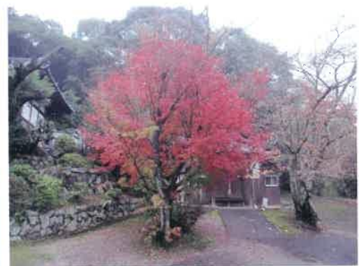
久井村の真言律宗 松林寺跡