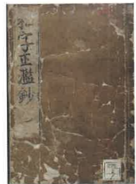
「和字正濫鈔」(中之島図書館蔵)