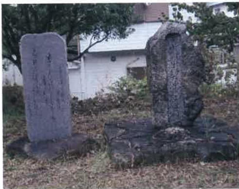
久井村 契沖の在所