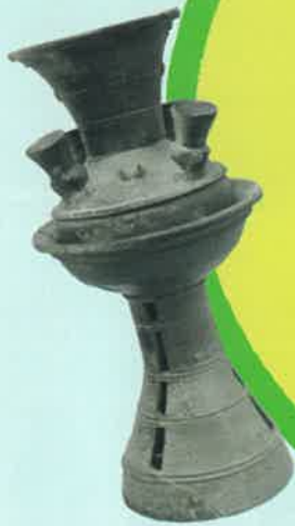
信太千塚古墳群 78号墳 (姫塚古墳) 須恵器 和泉市教育委員会蔵