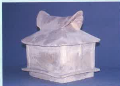
菩提池西遺跡 3号墳 家形埴輪 泉大津高等学校蔵