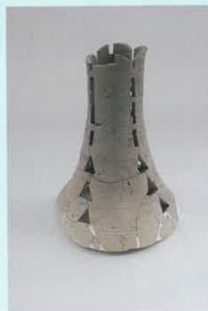
信太千塚古墳群 信太狐塚古墳 須恵器 和泉市教育委員会蔵