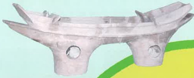
菩提池西遺跡 3号墳 船形埴輪 泉大津高等学校蔵