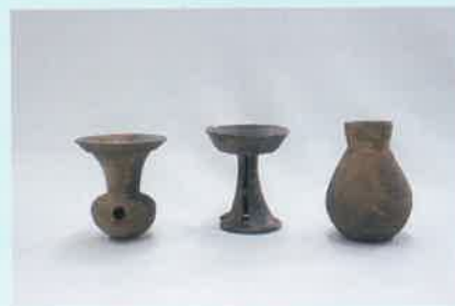
信太千塚古墳群 80号墳 須恵器 和泉市教育委員会蔵