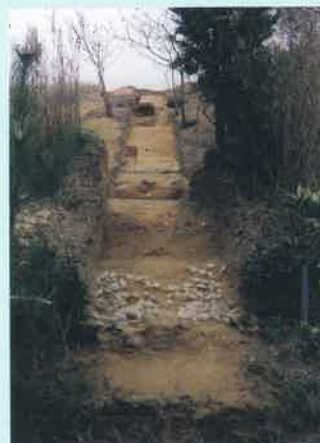
発掘調査時の和泉黄金塚古墳