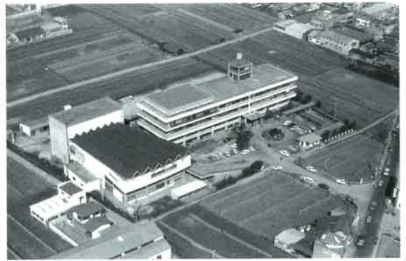
和泉市庁舎と市民会館1964年頃