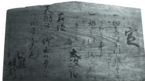
五榜の掲示 第3札(1868年)