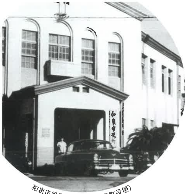
和泉市役所仮庁舎(旧和泉町役場)

和泉市の歴史8 『和泉市の近現代』刊行記念 和泉市いずみの国歴史館 令和3年度冬季企画展