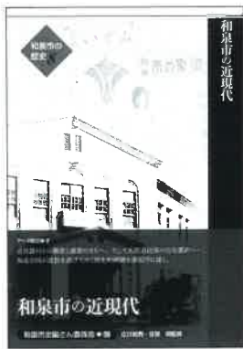
和泉市の歴史8『和泉市の近現代』

本展では、和泉市の歴史8『和泉市の近現代』(和泉市史編さん委員会編)の刊行を記念し、[行政][戦争][教育][開発]をテーマに、諸資料や古写真などから、郷土和泉で生きた先人たちの足跡(あしあと)をたどります。