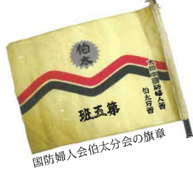
国防婦人会伯太分会の旗章