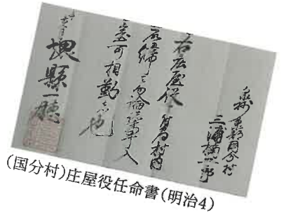
(国分村)庄屋役任命書(明治4)