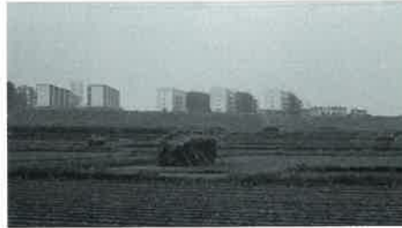
大阪婦人子供服団地遠景1960年代