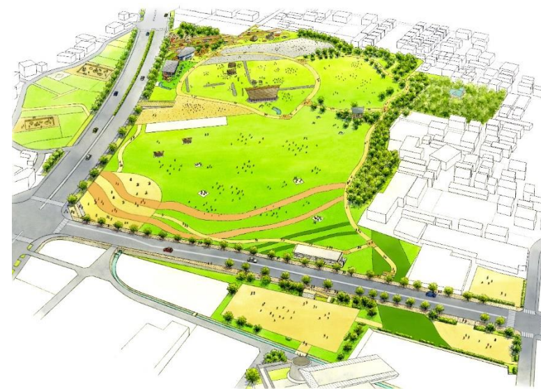
再整備・第2期第2次整備イメージ図