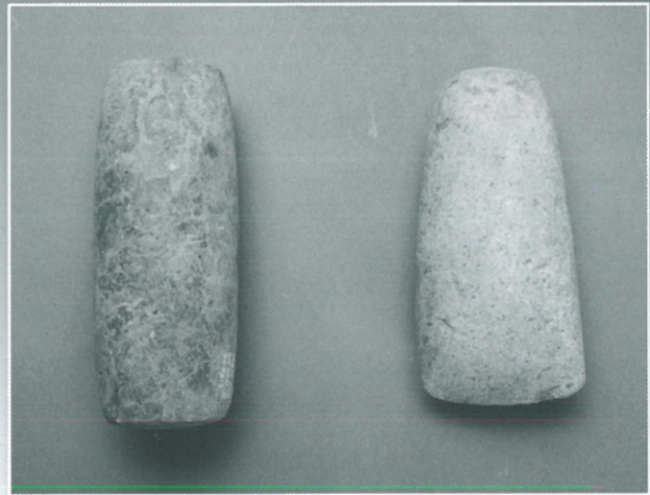
分銅型石製品と太形蛤刃石斧（和泉市教育委員会）