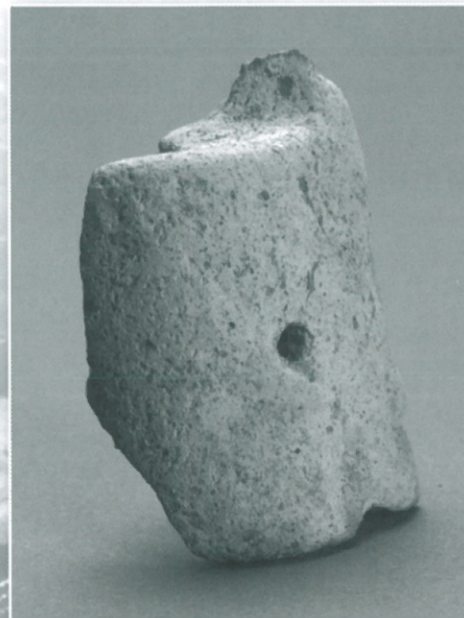
銅鐸型土製品（和泉市教育委員会）