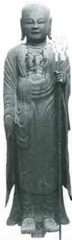
和泉市指定文化財 地藏菩薩立像（施福寺蔵）