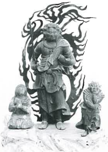
和泉市指定文化財 不動明王・二童子像（施福寺蔵）