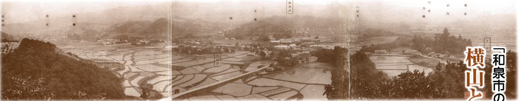
横山村全景（戦前に発行された絵はがき）