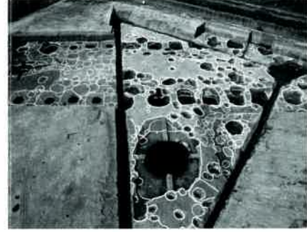
池上曾根遺跡の大型建物と井戸