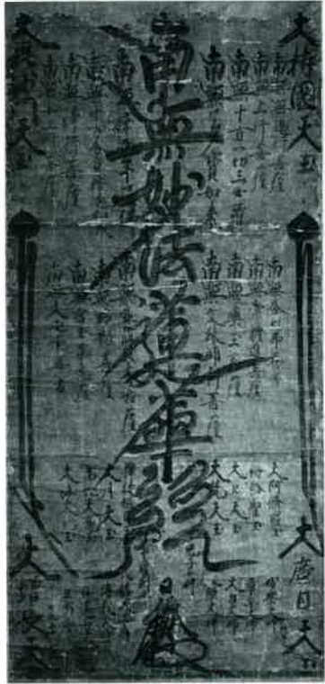
日像筆・法華経曼荼羅(和氣座六人衆蔵)