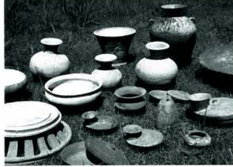
泉北丘陵窯跡群光明池地区出土の須恵器