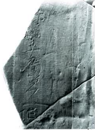
和泉寺跡出土文字瓦 [弥縣主廣足 作](大阪府教育委員会蔵)