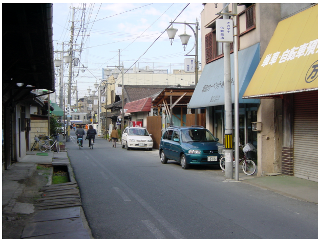
再開発事業着手前(H12.11)