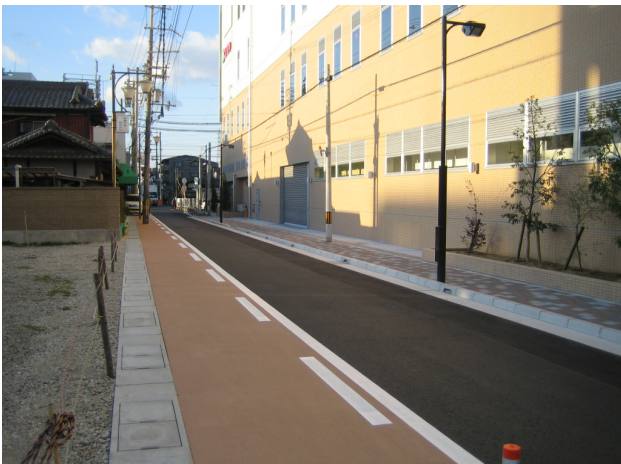
再開発事業着手後(H22.12)