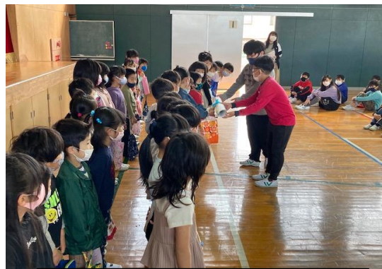
「校歌」の歌詞を書いた掲示物を プレゼントしました