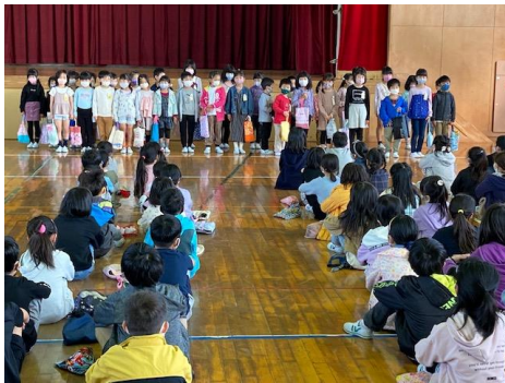
1年生と全校児童の対面です