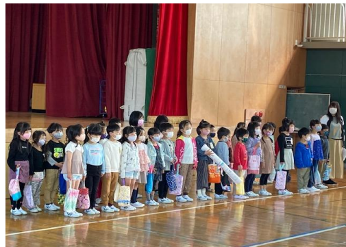
1年生はきちんと整列できていました