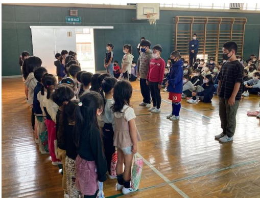
児童会役員からよろしくのあいさつです