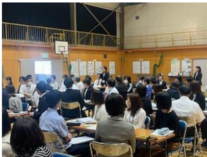
すくろおんぱうあめんと (SE) すいしんじぎよう 推進事業 「学校図書館を充実・活用するためのモデル校」 がっこうとしよかんじゆうじつかつよう けんきゆうはっぴようかいふないしないきょうしよくいん 研究発表会 (府内・市内の教職員 )