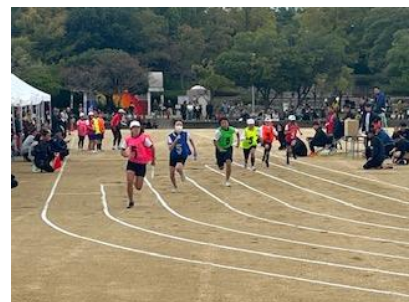
いずみししやうがっこうりくじやうきやうぎかい 和泉市小学校 陸上競技会