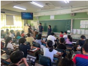
あしべきゆうしよくでまえじゆぎよう 芦部給食プロジェクト出前授業 (5年) 芦部給食プロジェクト出前授業 (5年)