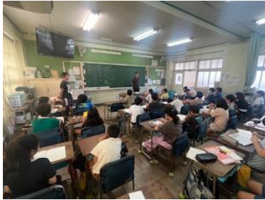
せんもんてんでまえじゆぎよう 「専門店とスーパー」の出前授業 (3年) 「専門店とスーパー」の出前授業 (3年)