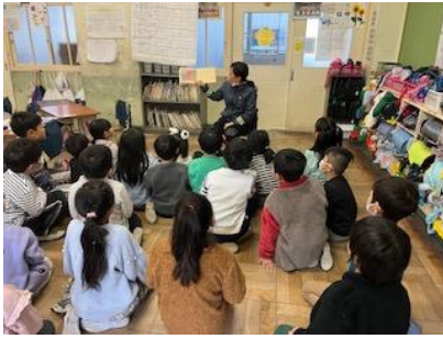
あさかいでのよききかき (1年) 朝の会での読み聞かせ (1年)