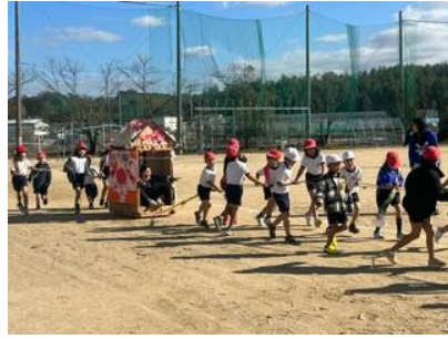
だんじりまつり (2年) だんじりまつり (2年)