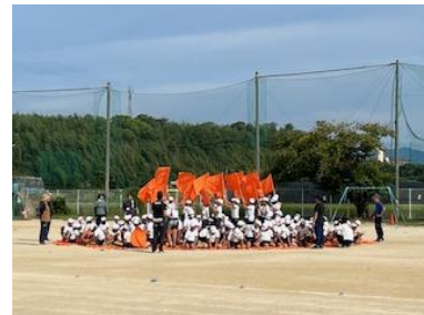
かんとう 感動のファイナル スポーツフェスティバル (6年) 感動のファイナル スポーツフェスティバル (6年)