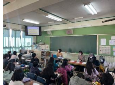
にんちしようようせいこうざ 認知症サポーター養成講座 (4年) 認知症サポーター養成講座 (4年)