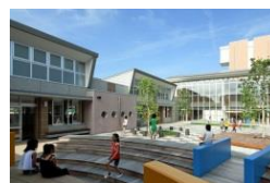
校舎や教室と隣接したステージ、広場などには、上履きのまま出られることで授業や休み時間が充実