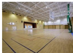
体育館：部活動の利用も踏まえた広さ