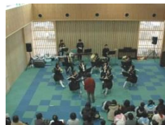
多用途に対応した多目的室