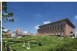
築山のある芝生の広場