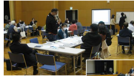
学校開校準備委員会の 意見交換の様子