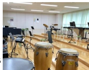
特別教室：小中の授業内容に対応した設備を整備

続いて、他市における特色ある施設例を紹介し、今後の施設整備にあたり、「今の学校のいいところ」、「新しく始めたい活動」、「継続したい活動」等の観点で意見を出し合いました。その後、新たな学校の特色となる「榎尾ブランド」を検討しました。