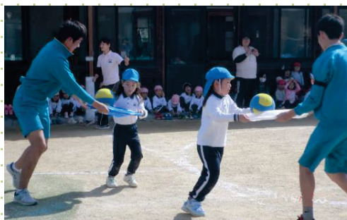
きのみこども園と榎尾中学校の交流