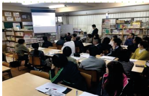
3校合同の職員研修