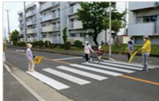
地域による見守り活動