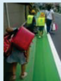
グリーンベルト整備