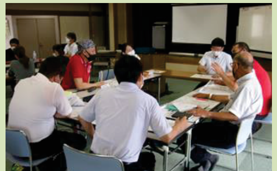
第1回プロジェクト会議の様子