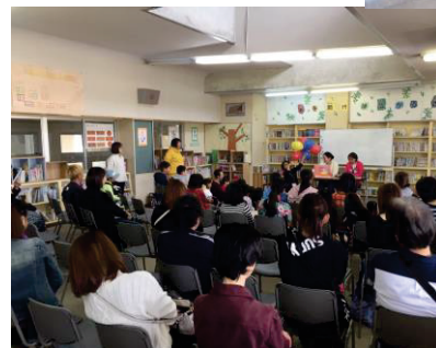
新しい学校図書館 イメージ