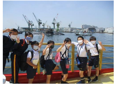
5年神戸ベイクルーズ ・グリコピア神戸