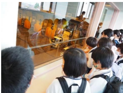
4年生 泉北クリーンセンター ・すばるホール