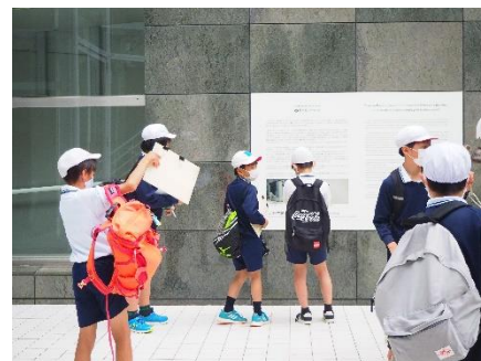
6年生 ピース大阪 ・大阪城公園

4月26日(火)に2・4・6年生が春の遠足に行きました。少し雨の心配があるような天気予報でしたが、外でお弁当を食べることができ、1日楽しく過ごすことができました。